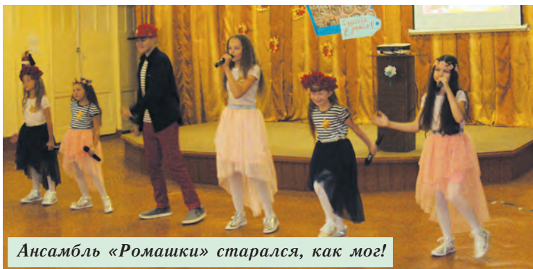
Ансамбль «Ромашки» старался, как мог!