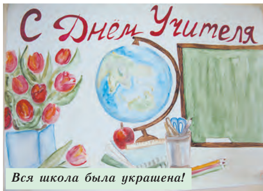
Вся школа была украшена!