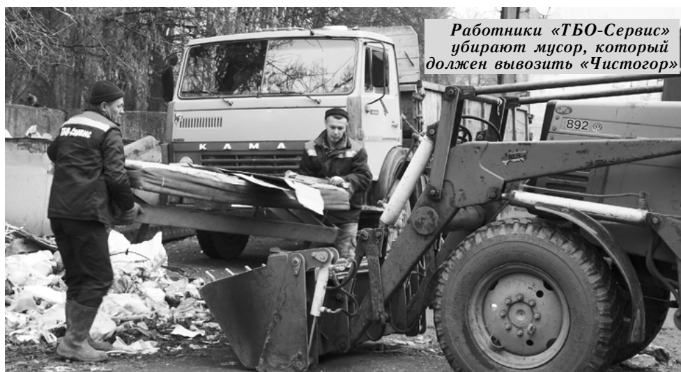
Работники «ТБО-Сервис» убирают мусор, который должен вывозить «Чистогор»