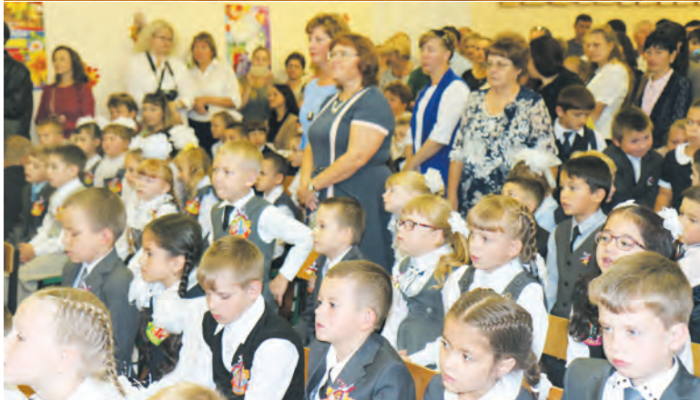
Первые учительницы школы №7 в первый школьный день были настоящими проводниками всех первоклашек!

Но хочется призвать всех учеников нашей школы, да и всего района — делайте приятное своим учителям не только в День учителя! Ведь самый приятный подарок, который мы можем сделать нашим педагогам — это наши успехи в учении, поведении, прилежании! А такие подарки каждый из нас в силах дарить учителям весь учебный год!