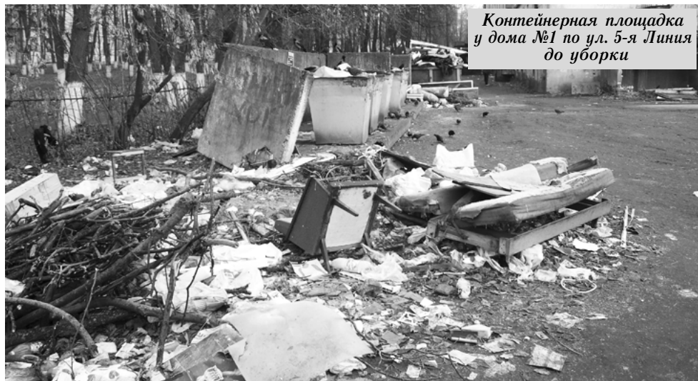
Контейнерная площадка у дома №1 по ул. 5-я Линия до уборки