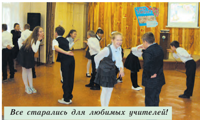
Все старались для любимых учителей!