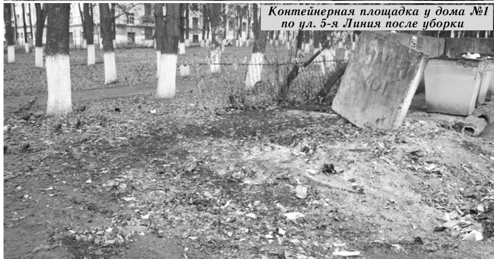
Контейнерная площадка у дома №1 по ул. 5-я Линия после уборки

В целях выполнения основных положений Правил по обеспечению чистоты, порядка и благоустройства на территории муниципального образования город Кольчугино Кольчугинского района, надлежащему содержанию расположенных на ней объектов, утверждённых решением Совета народных депутатов города Кольчугино от 27.07.2017 №410/68, администрацией Кольчугинского района постоянно осуществляются рейды по надлежанию содержанию и эксплуатации объектов благоустройства, которыми являются контейнерные площадки, расположенные на территории города.