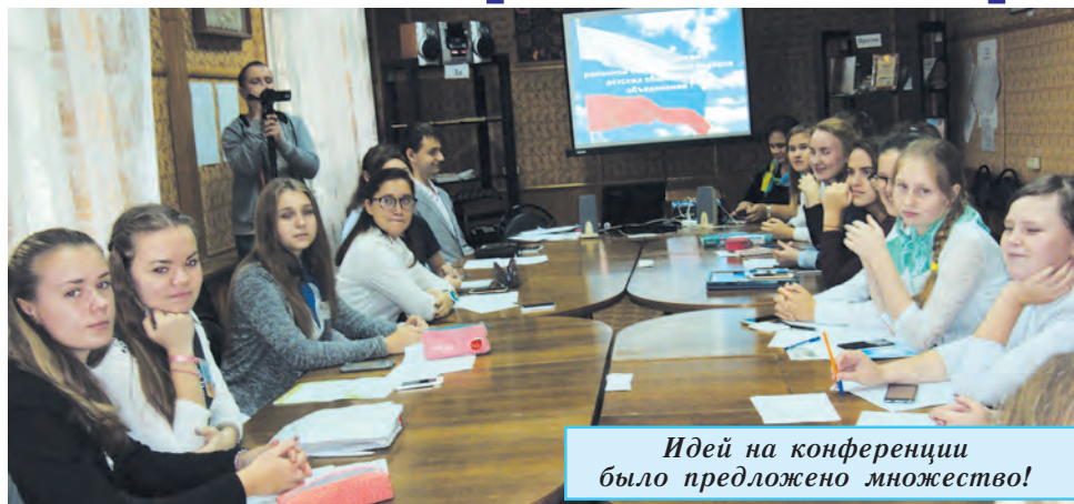
Идей на конференции было предложено множество!

На наш вопрос, кому интереснее участвовать в РДШ, взрослым или детям, ответы были следующие: «Интересно