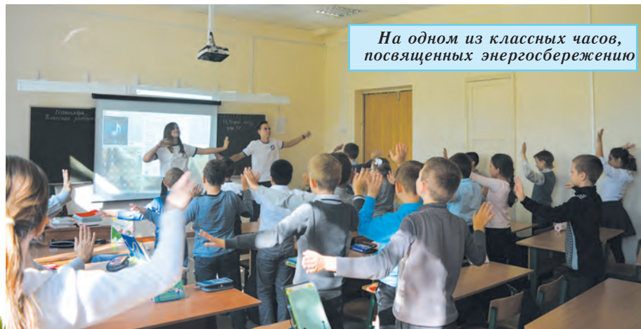
На одном из классных часов, посвященных энергосбережению