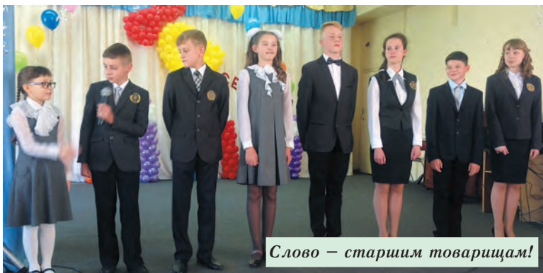
Слово — старшим товарищам!

Информационный комитет ДО «Будущее России» школы №1