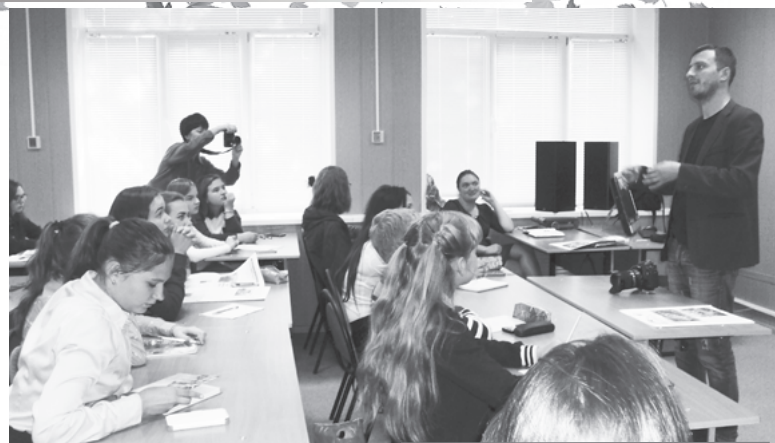
На занятиях «Школы юного корреспондента»

Мы с любопытством ехали в город Владимир на занятия школы, волновались, предвкушали интересные открытия и новые знания. И не ошиблись! С первых же занятий узнали много нового и о профессии журналиста, и о роли настоящего лидера в школьном коллективе. Получили серьезные