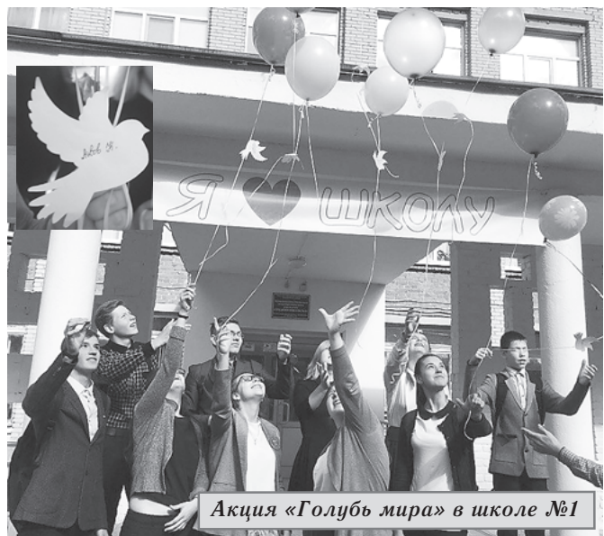
Акция «Голубь мира» в школе №1