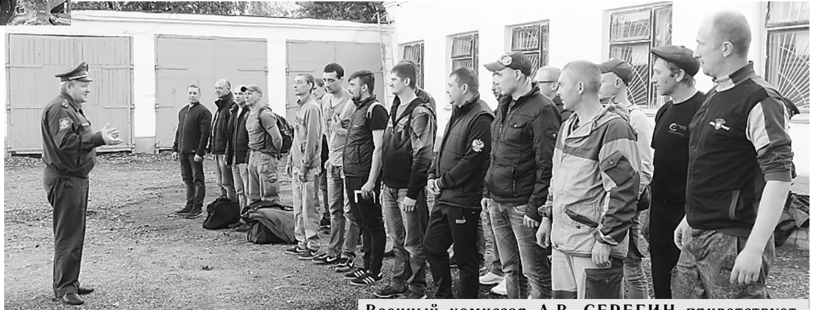
Военный комиссар А.В. СЕРЕГИН приветствует кольчугинских воинов

14 сентября Кольчугинский военный комиссариат встречал команду кольчугинцев, вернувшуюся после прохождения подготовки к совместным стратегическим учениям «Запад-2017». Цель учений — проверка возможности России и Беларуси обеспечения безопасности государств, их готовности к отражению возможной агрессии, а также повышение слаженности органов военного управления, полевой и воздушной выучки соединений и воинских частей.