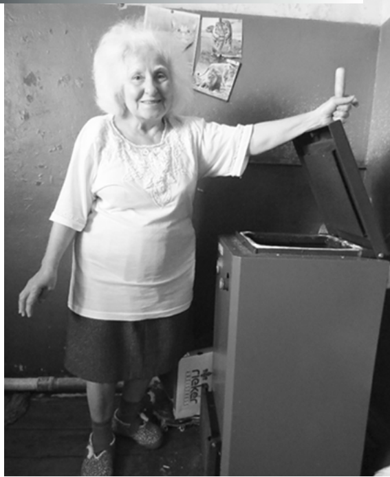
К 90-ЛЕТИЮ РАЙОННОЙ ГАЗЕТЫ