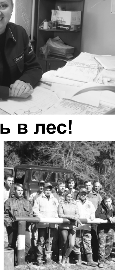
Всероссийский день посадки леса

— А в чем суть претензий населения к лесничеству?