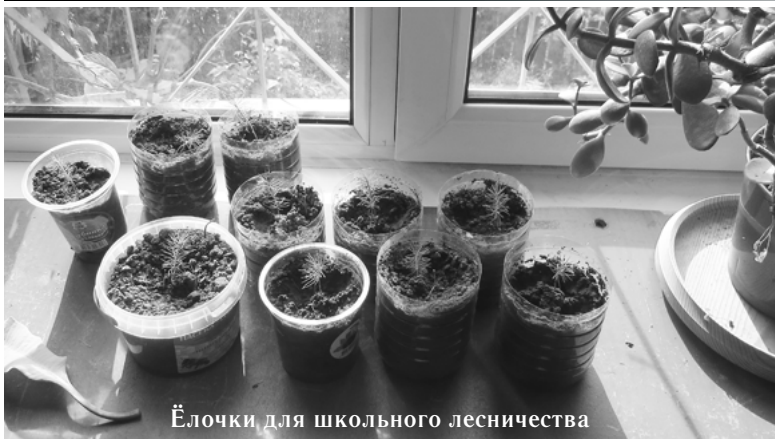
Ёлочки для школьного лесничества

На окне кабинета директора ГКУ ВО «Кольчугинское лесничество», среди привычных комнатных растений, несколько емкостей со всходами высотой всего в несколько сантиметров, заботливо расставленных прямо на солнцепеке. Но какие же всходы в сентябре?