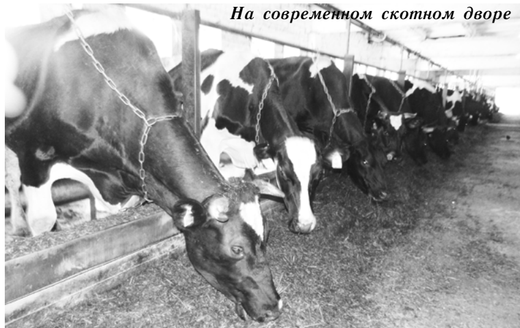
На современном скотном дворе

не заболело ли, пришло в охоту, не голодное ли... Все данные поступают на компьютер, в общую базу, которая находится в кабинете В.В. Митрофановой. Это позволяет при-