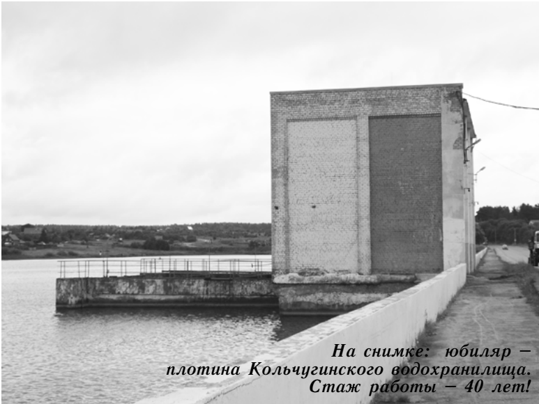
На снимке: юбилар – плотина Кольчугинского водохранилища. Стаж работы – 40 лет!

Максимальная длина – 7 км, максимальная ширина – 2 км, примерный объем – 14 миллионов кубических метров. Это основные параметры Кольчугинского водохранилища на реке Пекша.