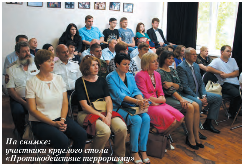
На снимке: участники круглого стола «Противодействие терроризму»