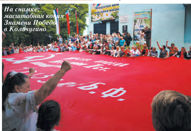
На снимке: масштабная копия Знамени Победы в Кольчугино