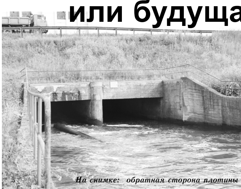
На снимке: обратная сторона плотины

без согласований практически никаких действий не предпринимает. А что же он тогда делает?