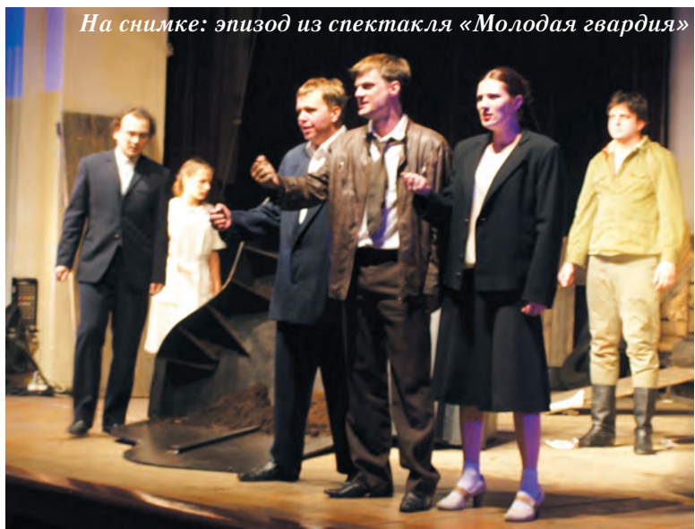
На снимке: эпизод из спектакля «Молодая гвардия»

— В самый решающий момент жители Крыма просто вышли на улицы и сказали, что они хотят быть с Россией. Их было очень много и поэтому достаточно было просто постоять на площади и помахать флагами. Крым бескровно воссоединился с Россией. А большинство жителей Одессы, Харькова, Луганска и Донецка в тот момент на площади не вышли. Наверное, они тогда решили свои семейные проблемы, пытались заработать какие-то деньги. Но в результате в Одессе была резня пророссийских активистов 2 мая, а в Харькове с недовольными разделились без лишнего шума. Луганск и Донецк вовремя опомнились, но из-за промедления получили кровавую войну, которая не прекращается и по сей день. Думайте, сравнивайте. У нас впереди 2018-й год, когда нам тоже достаточно будет всем