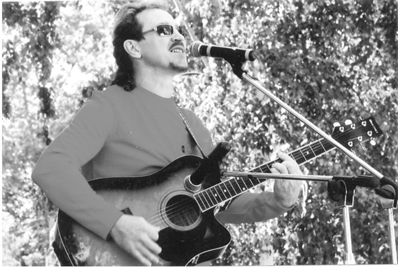
Друзья мои, читатели. Как вы заметили, в своих публикациях я знакомлю вас с нашими талантливыми земляками, своим трудом и творчеством прославляющими землю кольчугинскую. Сегодня моим героем будет один из них.