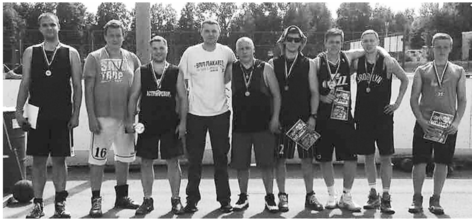
Команды финалистов турнира «Игра всей жизни»

В финале, похоже, удача отвернулась от «4 отряда», и те мячи, которые попадали в кольцо в предыду-