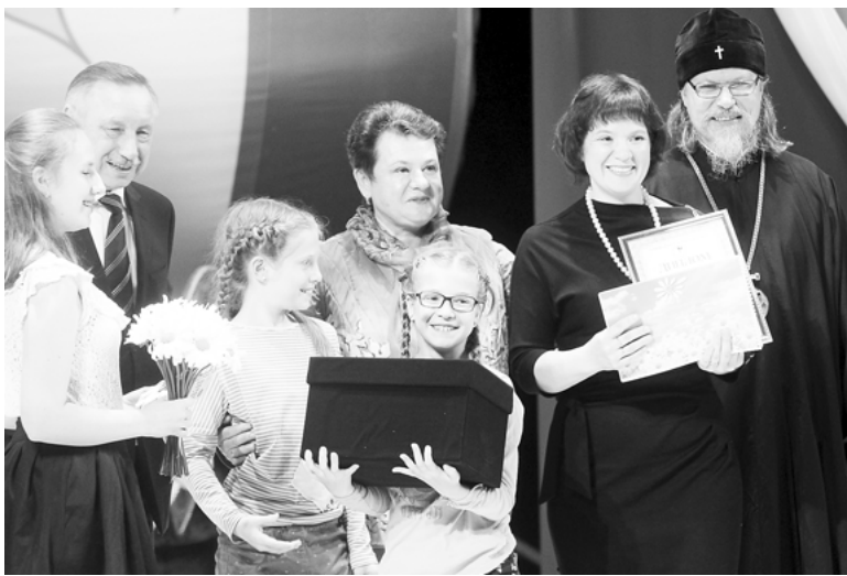
Чествование лучших семей Владимирской области

ВЛАДИМИРСКАЯ ОБЛАСТЬ В 10-Й РАЗ ОТПРАЗДНОВАЛА ДЕНЬ СЕМЬИ, ЛЮБВИ И ВЕРНОСТИ