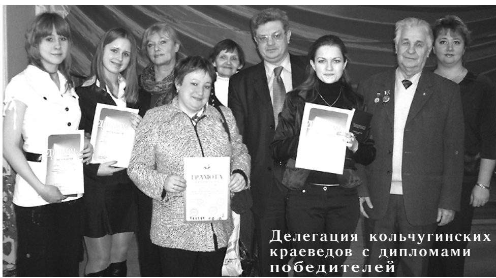
Делегация кольчугинских краеведов с дипломами победителей

Эти слова В.А. Сухомлинского стали основной идеей областного конкурса исследовательских краеведческих работ школьников «Отечество», который прошёл в субботу, 20 декабря, во Владимире. Нам, трём юным краеведам Кольчугинского района, победившим на прошедшем недавно районном этапе этого конкурса, было дано право представить свои краеведческие работы на областном уровне и познакомиться с исследованиями других школьников. В конкурсе приняли участие более 60 ребят из всех районов нашей области, причём у каждого была своя особенная тема, близкая и интересная ему. Поскольку тематика краеведческих работ была очень разнообразна, комиссия разделила их на шесть секций, в каждой из которых были определены победитель и призёры, занявшие 2 и 3 места. Прослушав все работы, квалифицированное жюри