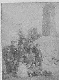
Монумент Славы, посвященный 5-й годовщине Октябрьской социалистической революции, парк ДК, 1922 год проект Верещагина А.П.