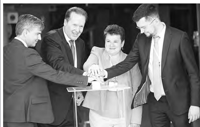
Запуск комбината в Великодворском

В посёлке Великодворский Гусь-Хрустального района состоялось открытие перерабатывающего комбината, который стал первым во Владимирской области предприятием по добыче и обогащению высококачественных кварцевых песков.