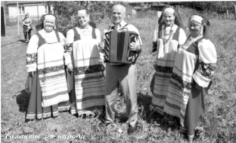
Таланты из народа

Причём, фестиваль не только показывает, но и усиливает это самое единство. Ведь не секрет, что лучший способ для этого — создание и укрепление личных связей между людьми с разных территорий. В данном случае фестиваль позволяет тем же артистам