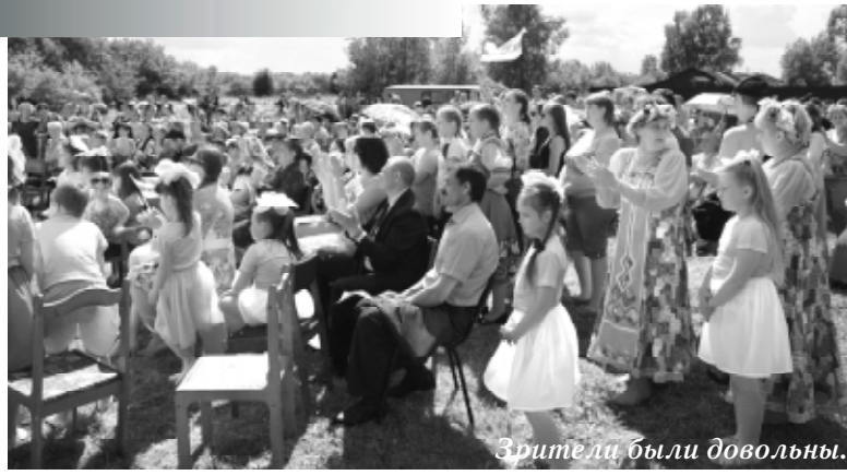
Зрители были довольны.

Да что там артисты? Главы поселений тоже получили удобную площадку для неформального общения между собой. А в результате, глядишь, и проблемы в районе легче решаться будут. И, наконец, фестиваль этот — «кочующий». Раньше была Золотуха, теперь Раздолье, в следующем году — Металлист, а потом ещё какое-нибудь село или посёлок. Жители этих населённых пунктов имеют возможность увидеть таланты со всей Кольчугинской земли! К ним гости со всего района съезжаются. А ещё тут торговлю открыли разными сладостями, напитка-