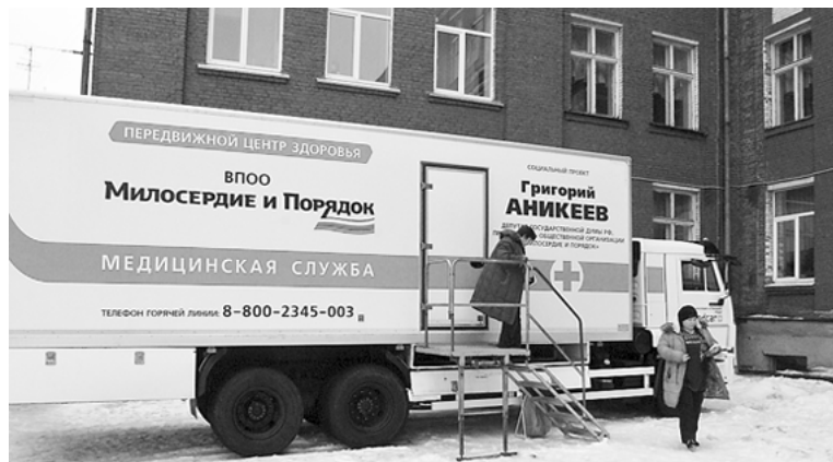
«Передвижные центры здоровья» — возможность пройти бесплатное обследование рядом с домом или работой.

Записаться к врачу можно заранее по телефону бесплатной горячей линии: 8 (800) 2345 003.