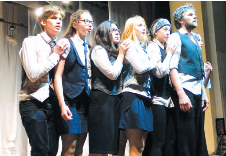
Окончание. Начало см. на стр. 1

11 разножанровых и разноплановых спектаклей было показано в ходе фестиваля. Практически половина из них — это детские спектакли, которые юные кольчугинцы встретили с восторгом.